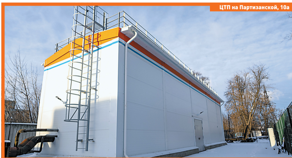
ЦТП на Партизанской, 10а