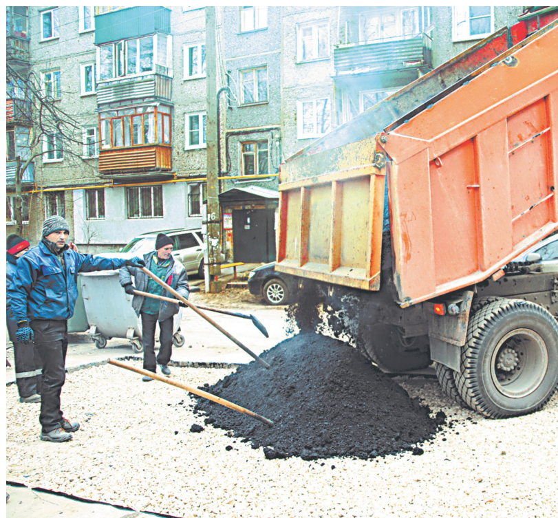
Работы по восстановлению асфальта на ул. Ивлиева, 14а.