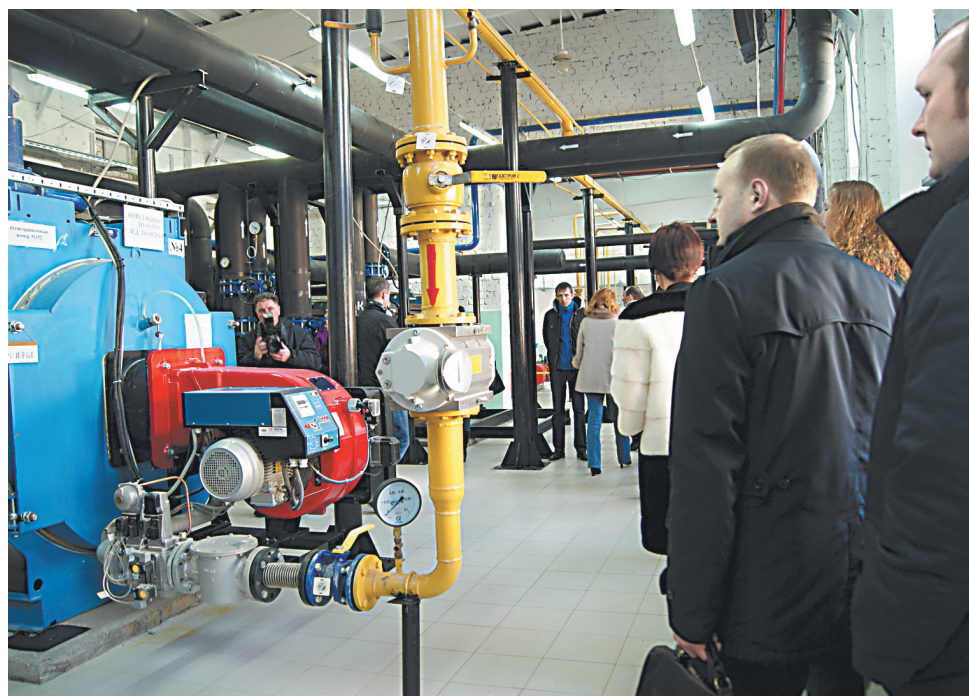
Участники форума посетили модернизированную в рамках энергосервисного контракта котельную на ул. Вольской, 15а