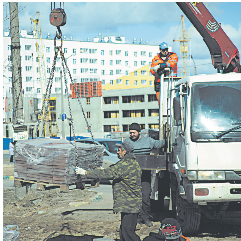
Восстановление пешеходной дорожки (перекладка брусчатки) на ул. Народной, 38.

Впрочем, год от года беспокойство и возмущение жителей медленно, но верно сходит на нет. И это не что иное, как результат выстраивания долгих доверительных отношений компании со своими потребителями. Опыт прежних лет показывает: если специалисты «Теплоэнерго» и впрямь берутся гарантировать горожанам, что все благоустройство после производства работ